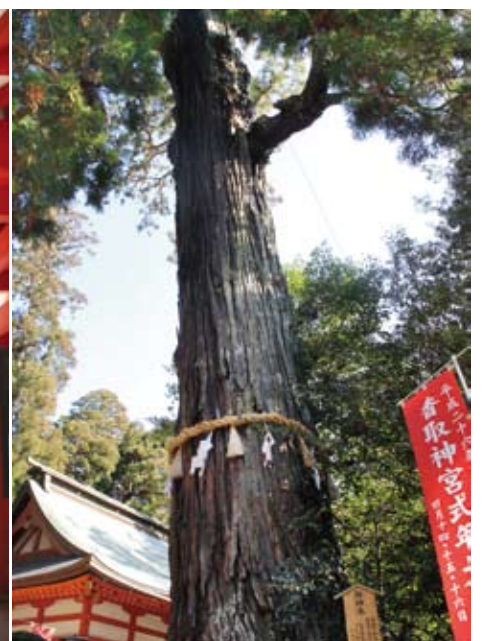
御神木の杉。目通りは約7.4mある