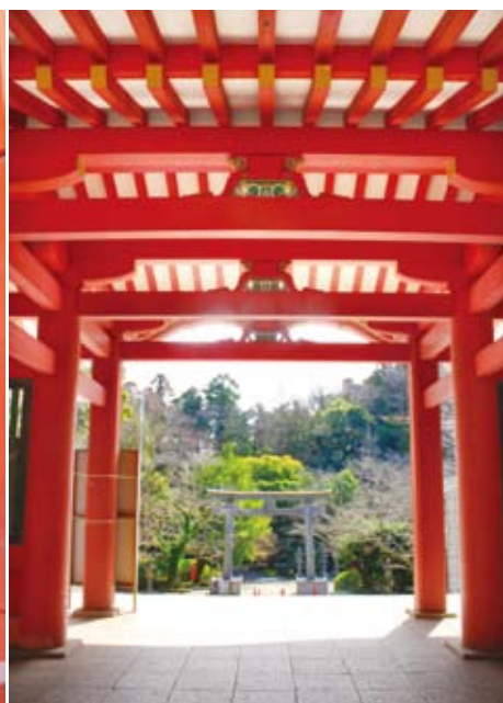
総門から見下ろす景色。眼下に参道鳥居が立つ