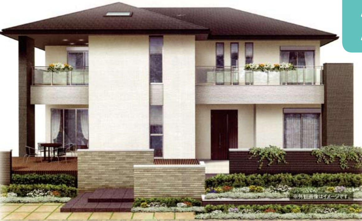
大人気、屋上に庭園のある家

ご来店時に口コルを見たと 言ってくださった方 先着30組様に 1,000円分の QUOカード をプレゼントいたします