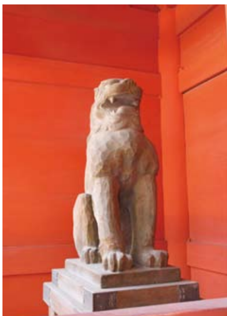
楼門内の木彫りの狛犬。参拝者を迎える