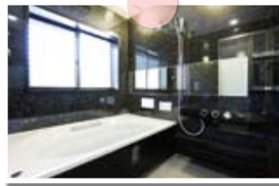
高グレード高品質の設備機器は標準設定