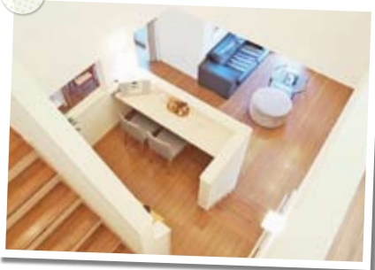
1階と2階をつなぐ多目的なスキップフロア

大切な家族と生活をともにするマイホームは、ずっと安心して快適に過ごせる空間であってほしいもの。タマホームの「新・大安心の家」は、長期優良住宅（※1）対応の頑強な家づくりと、家族のこだわりに対応する「自由設計」、充実の標準設備により、そうした思いに応えた理想の住まいの実現を可能にする。 高断熱・24時間換気システムを導入し冬は暖かく夏は涼しく過ごせる「快適さ」、木造軸組と耐力面材による優れた耐震性の「安心」はその基本だ。 そして、こうした高性能と自由度を備えながら、徹底的なコスト削減を通してできる限り抑えた価格に設定されている。