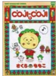
COJI-COJI 著=さくらももこ 出版=集英社 / 540円

『喰う寝るふたり住むふたり』結婚生活って、お互い言いたいことは山ほどあるもんだと思います。この作品では、恋人以上・夫婦未満の30代夫婦のリアルな日常を、一つのエピソードに対して夫婦の2人の視点から描いています。普段むかつく旦那にもちょっと優しくしてやろっかな...なんて気持ちにさせてくれる作品です。ちょっとドライな夫婦関係の方は必読です。