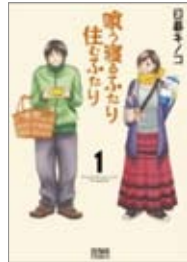
喰う寝るふたり 住むふたり 著=日暮キノコ 出版=徳間書店 / 590円

『喰う寝るふたり住むふたり』結婚生活って、お互い言いたいことは山ほどあるもんだと思います。この作品では、恋人以上・夫婦未満の30代夫婦のリアルな日常を、一つのエピソードに対して夫婦の2人の視点から描いています。普段むかつく旦那にもちょっと優しくしてやろっかな...なんて気持ちにさせてくれる作品です。ちょっとドライな夫婦関係の方は必読です。