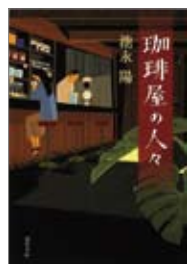
珈琲屋の人々 著=池永陽 出版=双葉社 / 650円

『珈琲屋の人々』「珈琲屋」という名の喫茶店をめぐる物語である。場所は総武線沿線の商店街、オーナーの行介は30歳代後半だ。そんな珈琲屋に集まる人々の人生は...。家計が苦しい和菓子屋の娘・省子、夫の浮気に悩むクリーニング店の元子など、近隣の人々の話が交錯する。中でも、定年退職した英治と妻の悦子の物語には、涙を誘われるだろう。