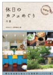
休日のカフェめぐり 千葉 編=休日のカフェ製作委員会 出版=幹書房 / 1,400円

『珈琲屋の人々』「珈琲屋」という名の喫茶店をめぐる物語である。場所は総武線沿線の商店街、オーナーの行介は30歳代後半だ。そんな珈琲屋に集まる人々の人生は...。家計が苦しい和菓子屋の娘・省子、夫の浮気に悩むクリーニング店の元子など、近隣の人々の話が交錯する。中でも、定年退職した英治と妻の悦子の物語には、涙を誘われるだろう。