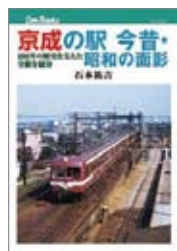
京成の駅 今昔・昭和の面影 著=石本祐吉 出版=JTBパブリッシング / 1,800円+税

『日本のエアポート02 成田空港』 この本は、「日本のエアポートシリーズ」第2巻として発売された。成田国際空港の施設群の配置、その役割、各航空会社の航空機とラウンジの紹介、さらには時刻表まで付いている。特に注目したいのは、成田空港年表だ。昭和36年から現在に至るまで、きめ細かく書かれている。(出版時と変わっている情報もあります)