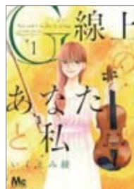
G線上のあなたと私 著=いくみき 出版=集英社 / 419円