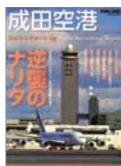
日本のエアポート02 成田空港 出版=イカロス出版 / 1,950円+税