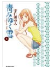
青みゆく雪 著=宇仁田ゆみ 著=小学館 / 524円

『G線上のあなたと私』 始まりから不幸な主人公。月曜日の夜7時に開かれる、大人のバイオリン教室。集まってくるのは、いろいろな悩みを抱えた初心者3人と講師。優雅なご趣味と思いきや、人間関係もバイオリンも一筋縄ではいかない。でも、3人の一生懸命な姿、成長してゆく姿を見ていると、自分も習い事をしたくなってくるーそんな作品です。