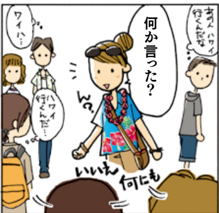
◎策略成功してるみたいよ、ロッコちゃん!