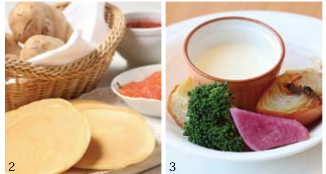
1.月替わりデザート20種類 2.4月の実演調理「クレープボンナンシェーヌ（ジャガイモのパンケーキ）」 3.季節野菜のパーニャカウダ