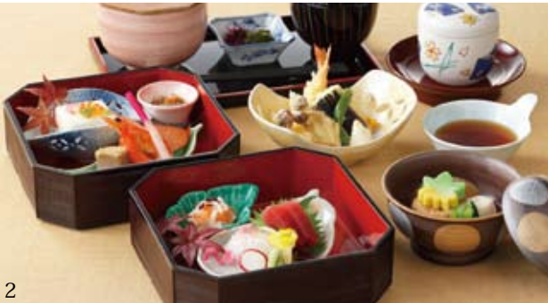
1.天然温泉に入れば、お肌はつるつるモチモチに。2.いろいろな料理を楽しむのがホテルの醍醐味。開催レストランが曜日やランチ・ディナーによって異なるので確認を。