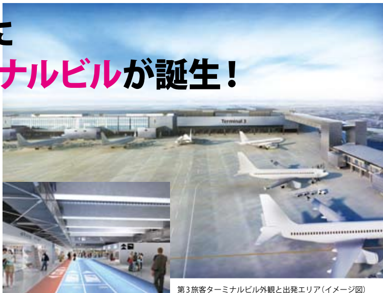
第3旅客ターミナルビル外観と出発エリア(イメージ図)

4月8日、成田国際空港に第3旅客ターミナルビルが誕生。同空港を拠点とする国内線LCC(格安航空会社)3社(Jエットスタージャパン/バニリアエ/SPRING JAPAN(春秋航空日本)のほか、Jエットスター航空、チエジュ航空が使用)ピーチは引き続き第1ターミナルを使用)。新ターミナルからは、札幌・大阪・広島・福岡・那覇等の国内12都市、ソウル・台北・香港・オーストラリア等の海外7都市に行くことができる。出発エリアは天井を張らず案内表示も床やはりを活用し、開放感のある空間を演出。フードコートは国内空港最大級の450席で、バラエティーに富んだ店が揃う。