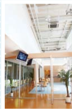
ホテルのおなじロビーでゆったりくつろげます