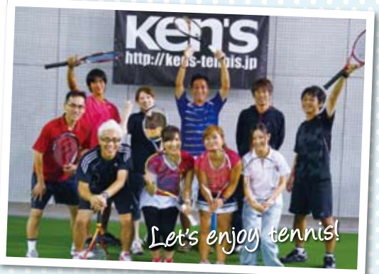
Let's enjoy tennis!