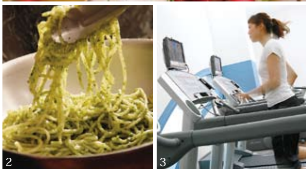
1.多彩な食材で作られるイタリアン 2.シェフが目の前で調理するライブキッチン 3.会員制だけど宿泊客は利用できるヘルスクラブ