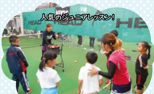
人気のジュニアレッスン!

一般クラスは5段階、小学生クラスは4段階、幼稚園クラスでは2種類と細かくクラス分け。上達する楽しさ・目標を持って取り組みます。