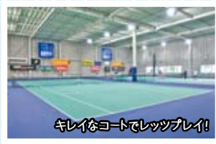
キレイなコートでレッツプレイ!