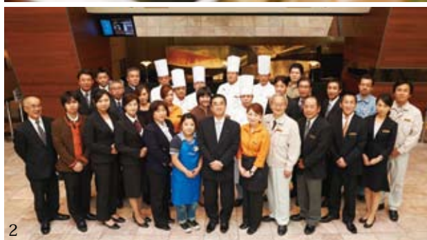
1.バイキングならみんなの好みも満足だし、中華のコースやオーダーバイキングもい いな! 2.お客様に感謝をこめてスタッフ一同