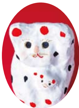
協力：佐原張子職人 鎌田芳朗さん(三浦屋)